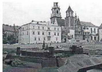
POLSKO - Wieliczka, Krakov, Oswiecim, Pszczyna